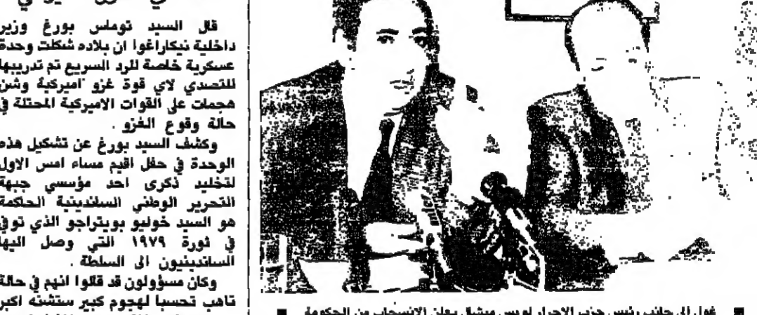
محل الى جانب رئيس حزب الاحرار لويس ميشال يعان الانسحاب من الحكومة

رفض الملك بودوان ملك بلجيكا امس استقالة الحكومة في اعطاب كارثة استاذ ميسل، وقال رئيس الوزراء ولفر مارتنز انه ستجري انتخابات مبكرة.